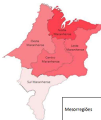
MESORREGIÕES MARANHENSES E PIB PER CAPITA